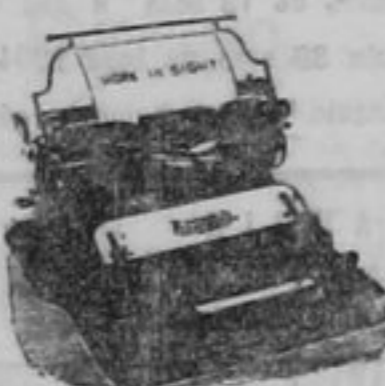
Модель 1903 года.

Написать буквъ автоматическн. Перемена прнфтовъ и вращеніяхъ лентъ поворачивалась безъ пачкающаго руля. Писаніе перемѣщается глазами. Абсолютная ровнота строкъ, прѣста работа, пишущая прнфтова. Полученіе многихъ копій на любой бумагѣ. Удобство полученія оригиналовъ для штемпелера.